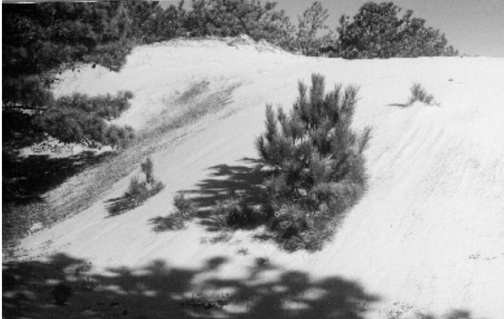
Figura 8: O crescimento dos pinus provocando o efeito barreira .

Ao mesmo tempo, o processo de captura estaria ocorrendo junto às bordas dos bosques, causando o empilhamento e a apreensão da areia. Constatamos que o fenômeno está sendo provocado pela unidirecionalidade do vento determinado pelos pinus.