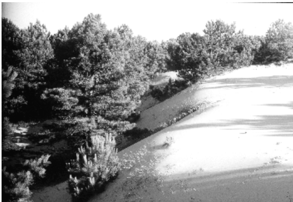
Figura 9: Areia capturada junto às margens dos bosques de pinus

Ao mesmo tempo, o processo de captura estaria ocorrendo junto às bordas dos bosques, causando o empilhamento e a apreensão da areia. Constatamos que o fenômeno está sendo provocado pela unidirecionalidade do vento determinado pelos pinus.