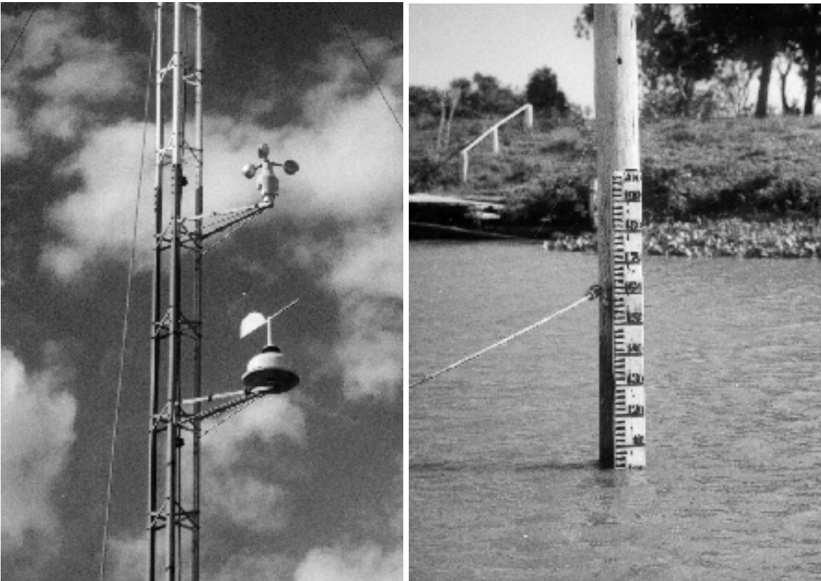
Figura 4 e 5: Estações de vento e limnométrica instaladas no CNT.

Para acompanhar a direção e a velocidade do vento foi montada uma estação provisória no Clube Náutico Tapense (CNT), distante aproximadamente sete quilômetros a oeste do Pontal de Tapes (figura 4 e 5). No local instalou-se um anemômetro e uma biruta na torre de rádio do clube, a 10 metros de altitude do solo. O primeiro trata-se de um equipamento analógico, cedido pelo Centro de Ecologia – UFRGS, e adaptado à leitura digital. Neste equipamento valores abaixo de 4km/h não são registrados, sendo estes considerados “calmaria”. Já a direção dos ventos será obtida por uma biruta eletrônica, disponibilizando oito rumos (cardeais e colaterais). Optou-se pela unidade de velocidade em quilômetros/hora. A escolha deu-se pela facilidade na assimilação dos valores e a rápida conversibilidade para metros por segundo, caso haja necessidade. As leituras dos instrumentos foram realizadas diariamente pelos funcionários do CNT, às 9horas e às 15horas (local), no período de 05/6/2002 até 20/08/2003.