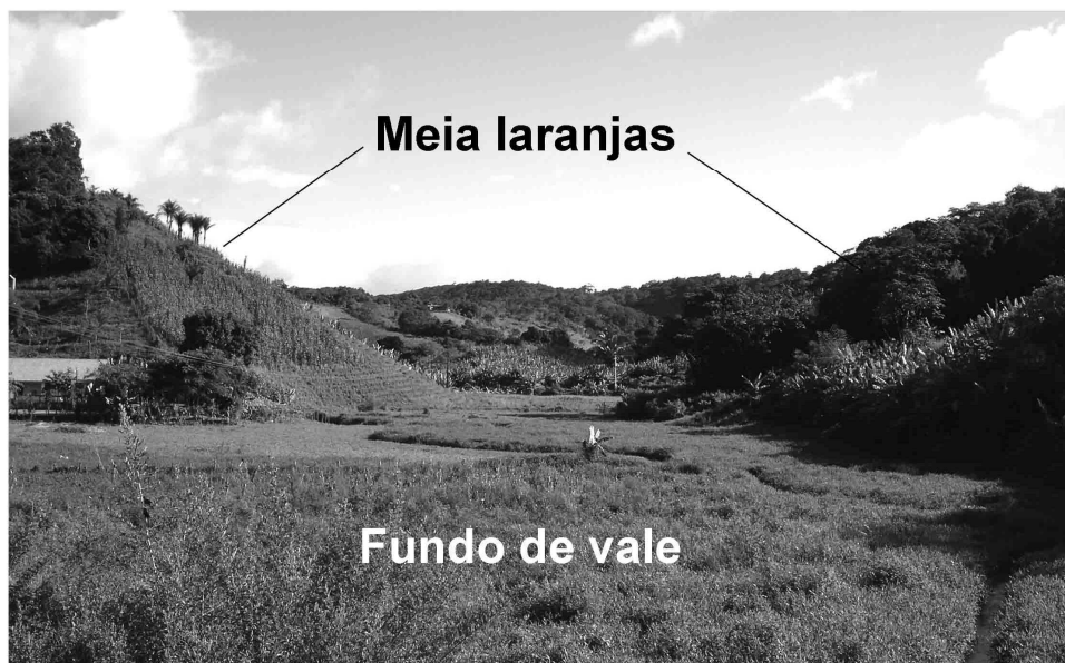
Figura 2 – A: Fundo de vale plano, com uma centena de metros de largura, entre as vertentes em meias-laranjas que se apresentam ocupadas por cultivos recentes de bananeiras em terraços, entre Mulungu e Aratuba (maciço de Baturité, Ceará). Observar o ângulo de concordância brutal entre as vertentes das colinas convexas e os fundos de vales planos, e a ausência de dissecação por escoamentos concentrados no fundo de vale.

bioclimático, pois os fundos de vale planos não têm nada de um pedimento. Se o termo pode não convir, ele pelo menos sugere um processo de evolução geomorfológica comandada por um recuo das vertentes íngremes das meias-laranjas, paralelas à elas mesmas. Esse tipo de evolução lembra claramente os processos de redução de meias-laranjas descritos na Índia, onde os fundos de vales planos se alargam correlativamente até atingir larguras superiores a 1 km, em um contexto bioclimático, litológico e morfotectônico similar (Gunnell e Bourgeon, 1997). Em um clima úmido, a retirada de material do sopé da vertente pelas variações sazonais do lençol freático é com efeito susceptível de garantir o solapamento lateral das vertentes das colinas convexas e a exportação dos detritos finos em direção às áreas rebaixadas adjacentes, formando os fundos de vales.