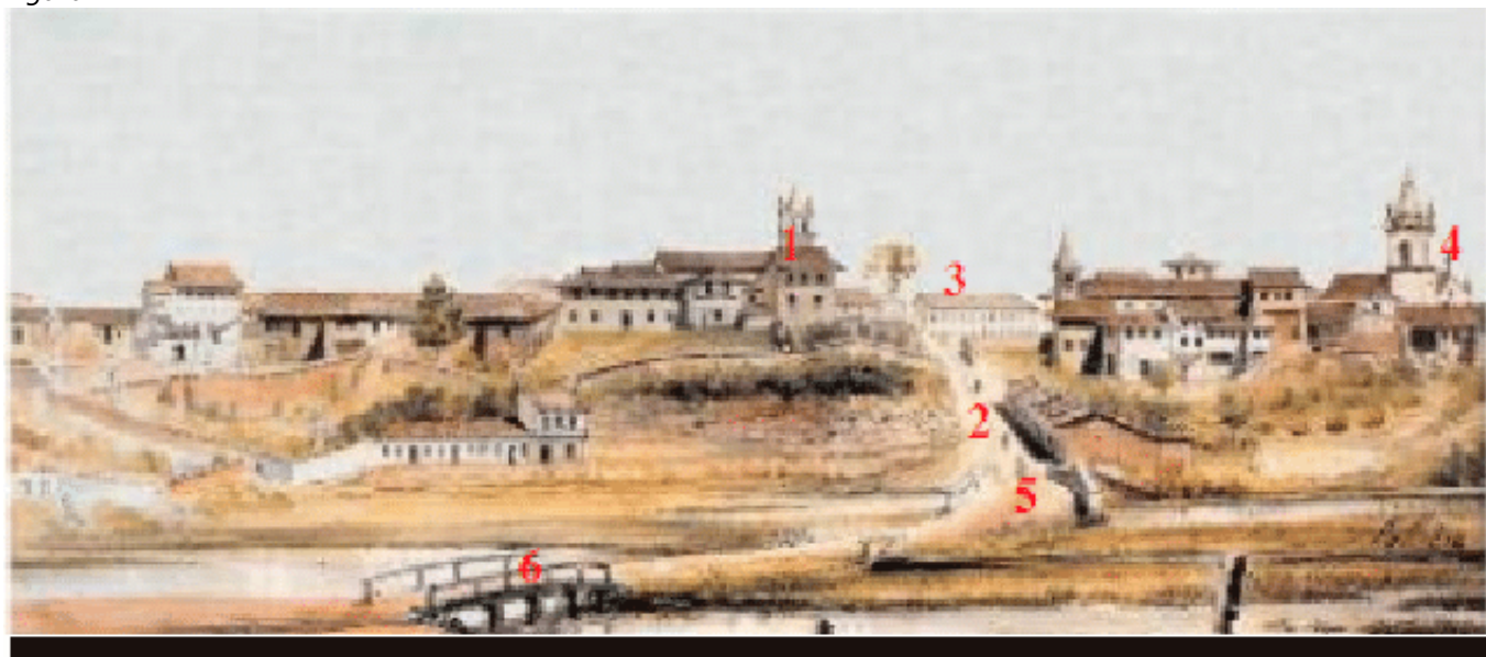
Vista da cidade à partir da Várzea do Carmo em 1821 Aquarela de Arnaud Julien Pallière, 1821. 1 - Igreja do Carmo; 2 - Ladeira do Carmo (atualmente, início da Avenida Rangel Pestana); 3 - Convento Santa Teresa; 4 - Igreja do Colégio; 5 - Ponte do Carmo