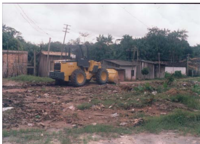
Figura 3 - Manejo indevido do lixo sobre as margens do igarapé do açude Maguari. Ao fundo a ocupação espontânea

A alteração do leito do igarapé pelo aterramento das margens provoca diminuição do espaço de vazão da água no canal. Assim, o transbordamento é inevitável atingindo a população do entorno.