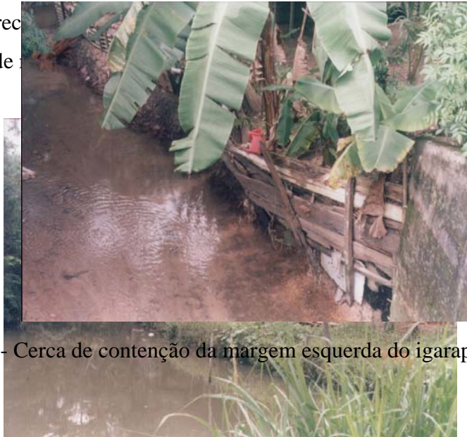
Figura 4 - Cerca de contenção da margem esquerda do igarapé do açude Maguari

O ponto 3 encontra-se sobre o igarapé Itabira (Figura 4). Este é mais extenso que o anterior e no trecho da margem esquerda há uma indústria de móveis em madeira. A margem direita é ocupada por