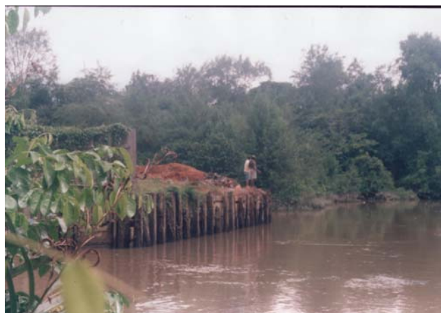
Figura 5 - Recuo artificial da área de vazão do Rio Maguariçu. (Local serve para atraque de pequenas embarcações)