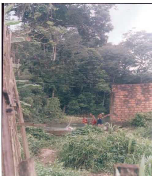
Figura 2 - Açude em trecho do igarapé afluente do rio Maguariaçu.

Nos dois pontos de observação do canal do igarapé do açude Maguari, constatou-se que, o ponto 1, é conhecido como açude Maguari em função da largura do seu canal em trecho próximo à nascente (Figura 2). O açude é utilizado para recreação da população e habita nas palafitas construídas sobre a planície de inundação. O depósito de resíduos sólidos é freqüente e o manejo que é realizado, objetiva o aterramento desta área (Figura 3).