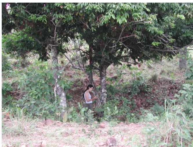
Fig. 04: Dolina de dissolução em carste subjacente. Fazenda Engenho Velho, município de Lassance.

Foram reconhecidos processos de carstificação sotopostos a camadas insolúveis, que o definem como carste parcialmente coberto. Na fig. 04, os terraços aluvionares e coluvionares, de idade Quaternária, representam os depósitos insolúveis que recobrem as dolinas de dissolução desenvolvidas em metacalcário.