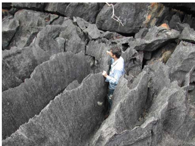
Fig. 03: Campo de lapíás , Fazenda Riacho Seco/Bocaina.

Em determinadas áreas desse Carste, ocorrem zonas de descarga (exemplo Lapa D'água, cavidade localizada na cabeceira do Riacho Seco) e de recarga (vale cego da Caverna Engenho Velho).