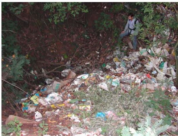
Fig. 05: Resíduos sólidos numa dolina de dissolução, Fazenda Engenho Velho.

3. Observou-se a existência de poços artesanais nas fazendas sem nenhum tipo de controle por parte do Serviço Autônomo de Água e Esgoto (SAAE) da prefeitura de Lassance. O bombeamento excessivo pode acelerar o processo de dolinamento na região.