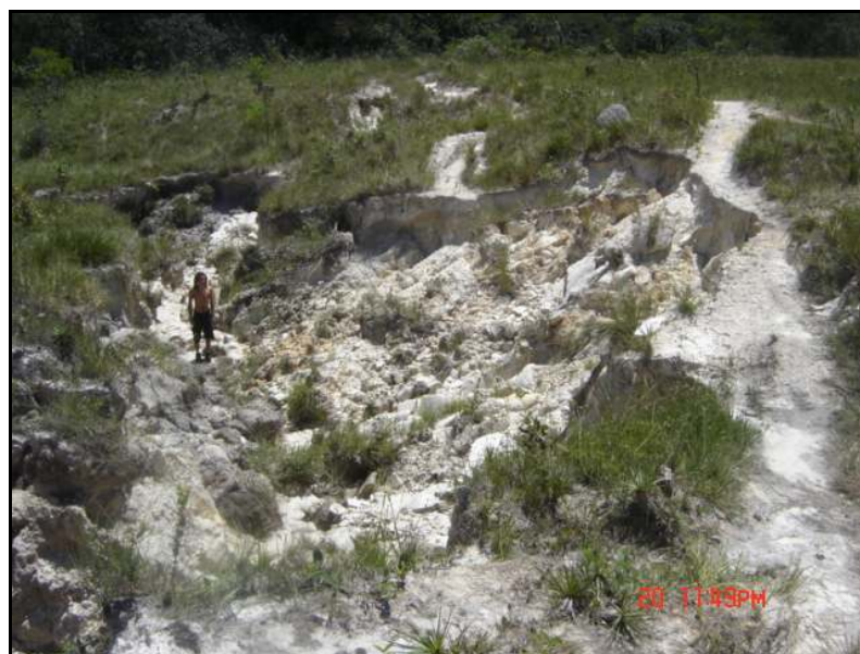
Fig. 4 - Voçorocamento localizado num antigo traçado da Trilha Farofa. Observar o avanço do processo erosivo sobre leito da trilha à direita da foto (DUARTE, 2009).

Algumas implicações relacionadas à abertura de trilhas e compactação do solo podem ser verificadas ao longo da Trilha Farofa, referentes à ocorrência de feições erosivas lineares aceleradas (voçorocamentos), resultando em grave degradação em segmentos específicos da mesma (ALMEIDA, 2005; GUALTIERI-PINTO, 2008; GUALTIERI-PINTO et al, 2008; DUARTE, 2009). Isso coloca em risco a integridade física do visitante (Fig. 4), obrigando os gestores da unidade de conservação a criarem outro traçado para o segmento afetado, desviando-o do problema erosivo.