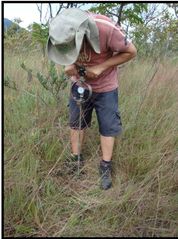
Fig. 2 – Utilização do penetrômetro de cone com anel dinamométrico.

A resistência de penetração ( q_c em \text{Kgf/cm}^2 ) foi obtida dividindo-se a carga de penetração (em \text{Kgf} ) pela área da base do cone (em \text{cm}^2 ). Como o diâmetro da base do cone é 28,4 mm, a área da base do cone é 6,33 \text{ cm}^2 .